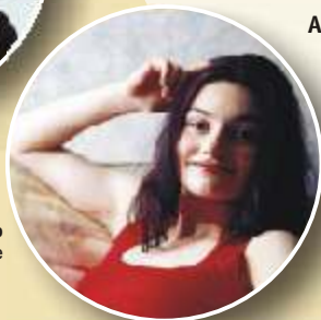
Giulia Ottonello cantante