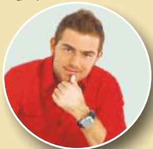
Daniele Bossari presentatore

Allora hai un buon motivo per partecipare alla Marcia non competitiva della Giornata Mondiale della Celiachia nelle città di Agrigento, Milano, Porto Cervo e Roma