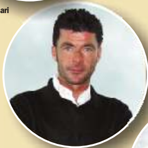
Gianni Bugno - ex ciclista campione del Mondo 91-92