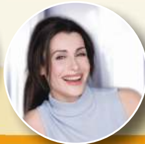
Claudia Koll attrice e presidentessa onoraria di AIC