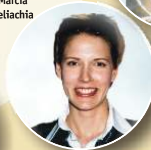
Gaia de Laurentis attrice