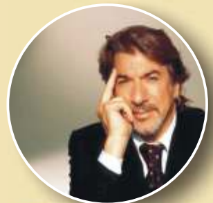
Marco Columbro presentatore